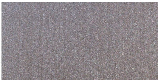
LS2 Bronzo scuro