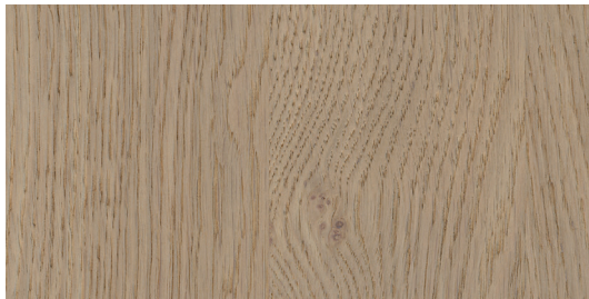
ET5 Rovere visone