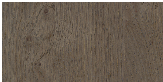
ET2 Rovere castoro