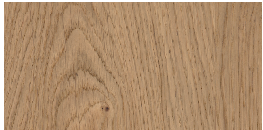
ET6 Rovere naturale