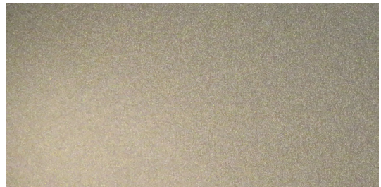
LA1 Bronzo scuro