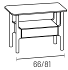
comodino 1 cassetto 1-drawer night stand