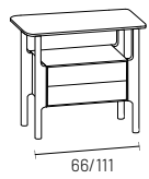
comodino 2 cassetti 2-drawers night stand