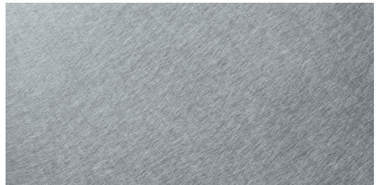
IX1 Inox Mat